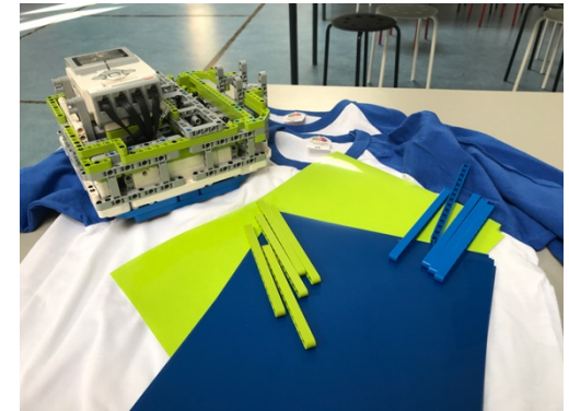
Our robot and shirts match!