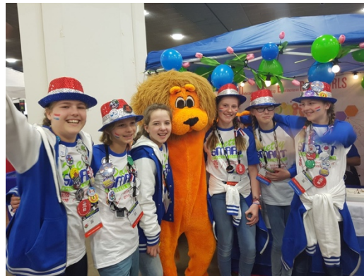
Dutch hats, makeup and ribbons for internationals