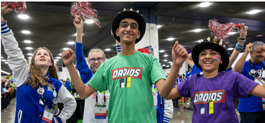
Pretty Smart susținând Droids la 2018 Detroit World Festival