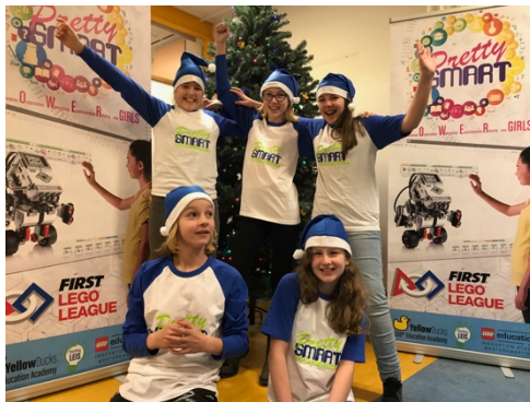
Christmas hats in december